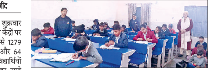
जीद। बुनियाद लेवल टू परीक्षा देते हुए बच्चे।

बुनियाद लेवल 2 परीक्षा शुक्रवार को जिलेभर में पांच परीक्षा केंद्रों पर हुई। 1343 विद्यार्थियों में से 1279 विद्यार्थियों ने परीक्षा दी और 64 विद्यार्थी गैर हाजिर रहे। विद्यार्थियों को दोपहर साढ़े 12 बजे तक परीक्षा केंद्र पर पहुंचना था। दोपहर बाद एक बजकर 30 मिनट से लेकर पौने तीन बजे तक परीक्षा रही। परीक्षा के समय विद्यार्थियों के आधार कार्ड और एडमिट कार्ड की जांच के बाद केंद्र में प्रवेश दिया गया। परीक्षा को लेकर जिलेभर में पांच केंद्र बनाए गए थे। समय-समय पर खंड शिक्षा अधिकारी व जिला विज्ञान विशेषज्ञ ने परीक्षा केंद्रों का निरीक्षण किया। परीक्षा शांतिपूर्वक रही। गौरतलब है कि बुनियाद कार्यक्रम स्कूल शिक्षा विभाग व हरियाणा सरकार की ओर से विकल्प फाउंडेशन के माध्यम से विद्यार्थियों को सक्षम व प्रशिक्षित करने के लिए शुरू किया गया