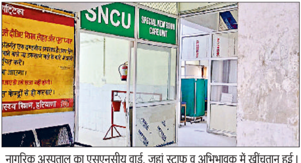
नागरिक अस्पताल का एसएनसीयू वार्ड, जहां स्टाफ व अभिभावक में खींचतान हुई।

गया। स्वास्थ्य प्रशासन ने मामले की शिकायत पुलिस को दे दी है। यह है मामला: एक नवजात शिशु के अभिभावक बच्चे को देखने के