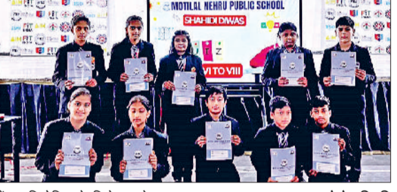
जीद। प्रतियोगिता के विजेता बच्चे।