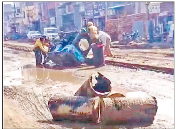
राजौद। मुख्य मार्ग पर पलटी ई-रिक्शा को निकालते लोग।

अभिभावकों ने आरोप लगाया कि स्टाफ ने ही उन्हें निजी अस्पताल में अपने बच्चे को ले जाने की बात कही। इस पूरी घटना का वीडियो भी बना। जिसे सोशल मीडिया पर अपलोड कर दिया गया। जिससे विवाद और बढ़ गया। वीडियो में अभिभावकों और स्टाफ के बीच गर्मागर्म बहस थी। हालांकि बाद में इस वीडियो को सोशल मीडिया प्लेटफॉर्म से हटा दिया गया। अभिभावक भी मौके से चला गया। नागरिक अस्पताल प्रशासन ने मामले को गंभीरता से लिया है। अस्पताल ने इस घटना की लिखित शिकायत स्थानीय पुलिस को दी है ताकि जांच हो सके और दोषियों पर उचित कार्रवाई की जा सके। प्रशासन का कहना है कि एसएनसीयू जैसे संवेदनशील वार्ड में मरीजों की सुरक्षा और प्रोटोकॉल का पालन सबसे महत्वपूर्ण है और किसी भी तरह की जबरदस्ती या गलत व्यवहार बर्दाश्त नहीं किया जाएगा।