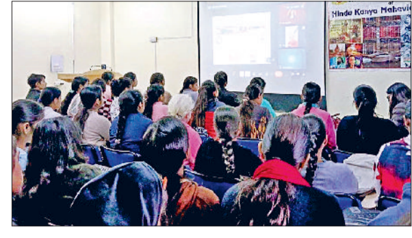
जीद। ऑनलाइन कार्यशाला में भाग लेते छात्राएं।