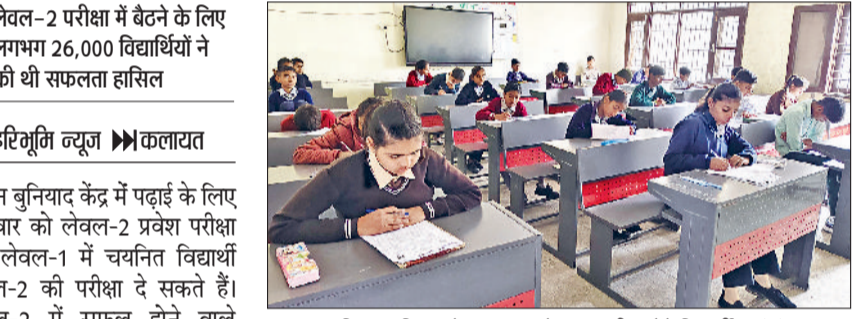
कलायत। मिशन बुनियाद के तहत एक केंद्र पर परीक्षा देते विद्यार्थी।

मिशन बुनियाद केंद्र में पढ़ाई के लिए शुक्रवार को लेवल-2 प्रवेश परीक्षा हुई। लेवल-1 में चयनित विद्यार्थी लेवल-2 की परीक्षा दे सकते हैं। लेवल-2 में सफल होने वाले विद्यार्थियों को लेवल-3 में भाग लेने का मौका मिलेगा। लेवल-3 में सफल विद्यार्थी अंतिम रूप से मिशन बुनियाद कार्यक्रम का हिस्सा बनेंगे। वे सत्र 2026-28 में कक्षा नौवीं व दसवीं की पढ़ाई मिशन बुनियाद केंद्रों से पूर्ण करेंगे। परीक्षा में वर्तमान समय में सरकारी स्कूलों की आठवीं कक्षा