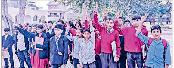
जुलाना। परीक्षा के बाद केंद्र से बाहर आते छात्र।

कार्यक्रम है। इसका मुख्य उद्देश्य विद्यार्थियों में विज्ञान के प्रति रुचि बढ़ाना व उनमें वैज्ञानिक दृष्टिकोण की नींव डालना है। विकल्प संस्थान की ओर से बुनियाद कार्यक्रम के तहत नौवीं कक्षा से ही विद्यार्थियों को जेईई व नीट के लिए तैयार करना आरंभ कर दिया जाता है। जिसके लिए नौवीं व 10वीं कक्षा में ही उन्हे नीट व जेईई की बेसिक कोचिंग दी जाती है। चयनित विद्यार्थियों को बुनियाद कार्यक्रम में बच्चों को निशुल्क वर्दी, पाठ्य पुस्तकें, टैबलेट के साथ ही सेंटर तक आने जाने के लिए भत्ता भी दिया जाता है। जिले में इस समय मिशन बुनियाद के तहत पांच केंद्र चल रहे हैं। इसमें राजकीय वरिष्ठ माध्यमिक विद्यालय जीद, राजकीय कन्या वरिष्ठ माध्यमिक विद्यालय जुलाना, मॉडल संस्कृत वरिष्ठ माध्यमिक विद्यालय सफीदों व पीएमश्री