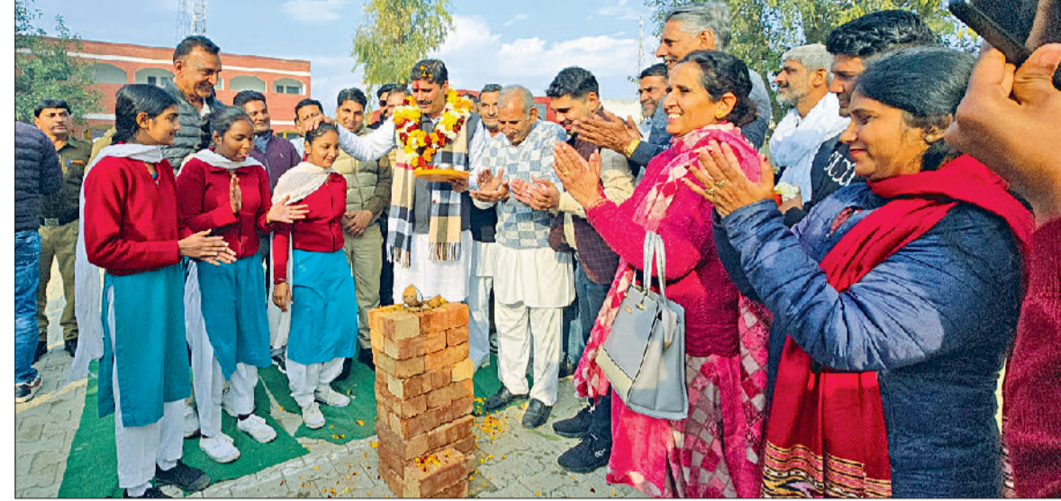
डांड/पुंडरी। राजकीय स्कूल में विकास कार्य का शुभारंभ करते हुए विधायक सतपाल जांबा।

पुंडरी विधानसभा क्षेत्र में शिक्षा एवं बुनियादी ढांचे को मजबूत करने की दिशा में एक बड़ा कदम उठाते हुए विधायक सतपाल जांबा ने 2 करोड़ रुपये से अधिक की लागत से विभिन्न स्कूलों एवं गांवों में कराए गए विकास कार्यों का उद्घाटन किया। इन विकास कार्यों में कक्षा कक्षों का निर्माण, शौचालय, चारदीवारी, लाइब्रेरी, स्टाफ रूम, एक्टिविटी रूम तथा आधुनिक ई-लाइब्रेरी जैसे महत्वपूर्ण कार्य शामिल हैं। विधायक सतपाल जांबा ने कहा कि स्कूलों में बेहतर व्यवस्था, स्वच्छ वातावरण और आधुनिक सुविधाएं उपलब्ध कराना उनका पहला कर्तव्य है। जब शिक्षा मजबूत होगी तभी आने वाला भविष्य सशक्त और आत्मनिर्भर बनेगा। सरकार का उद्देश्य है कि ग्रामीण व शहरी क्षेत्रों के स्कूलों में समान रूप से सुविधाएं उपलब्ध कराई जाएं, ताकि विद्यार्थियों को बेहतर शिक्षा का माहौल मिल सके। शिक्षा के साथ-साथ विधायक ने ग्रामीण विकास कार्यों पर भी फोकस किया। गांव म्योली में संजु बाबा वाली गली के निर्माण में ई-लाइब्रेरी कार्य, चूड़इमाजरा