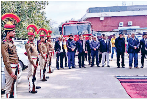
जीद। मौन रख कर श्रद्धांजलि देते अधिकारी व कर्मचारी।

कहा कि यह आयोजन केवल उन वीर बलिदानियों की स्मृति को ताजा करने का माध्यम नहीं है बल्कि देशभक्ति और कर्तव्यनिष्ठा की भावना को भी प्रबल करने का एक सशक्त अवसर है। लघु सचिवालय परिसर में मौन धारण कर अधिकारियों एवं कर्मचारियों ने शहीदों के प्रति अपनी कृतज्ञता और सम्मान व्यक्त किया। उन्हीं ने कहा कि आज अगर हम स्वतंत्र भारत में सांस ले रहे हैं तो यह उन्हीं वीर शहीदों की देन है। जिन्होंने अपने स्वार्थ से ऊपर उठ कर राष्ट्र के लिए सर्वोच्च बलिदान दिया।