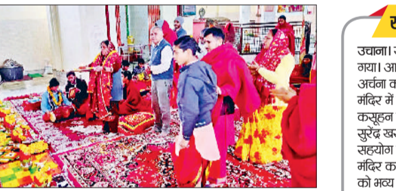
जीद। मां जयंती देवी मंदिर में पूजा करते श्रद्धालु।